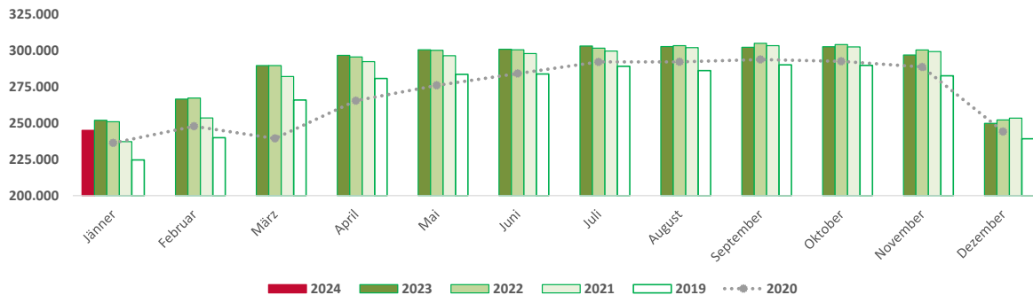
Abbildung 2: Unselbstständig Beschäftigte im Bau, Jänner 2019 bis Jänner 2024