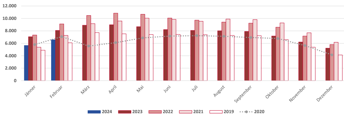
Abbildung 4: Sofort verfügbare offene Stellen im Bau, Jänner 2019 bis Februar 2024

Im Baubereich zeigte sich, wie auch gesamtwirtschaftlich, seit Anfang 2021 ein starker Zuwachs an beim AMS gemeldeten offenen Stellen. Die Anzahl der sofort verfügbaren offenen Stellen lag sogar seit Oktober 2020 fast kontinuierlich über dem Vorkrisenniveau, allerdings zeigen sich seit August 2022 Rückgänge im Vergleich zu den Vergleichsmonaten der Vorjahre (Abbildung 4).