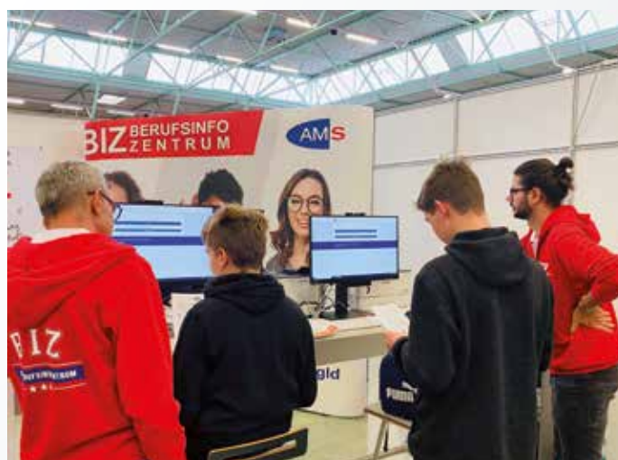
Das AMS Burgenland auf der BiBi 2022